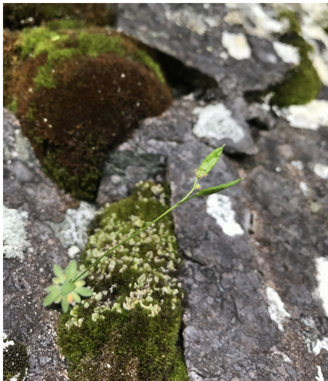
Ryc. 4. Draba dubia na stanowisku w Dolince (ok. 1560 m n.p.m.) w Tatrach Zachodnich. Wyraźnie widoczne charakterystyczne owłosienie liści, łodygi wraz z szypułkami oraz brak owłosienia na luszczynkach (22.06.2018 r.;)