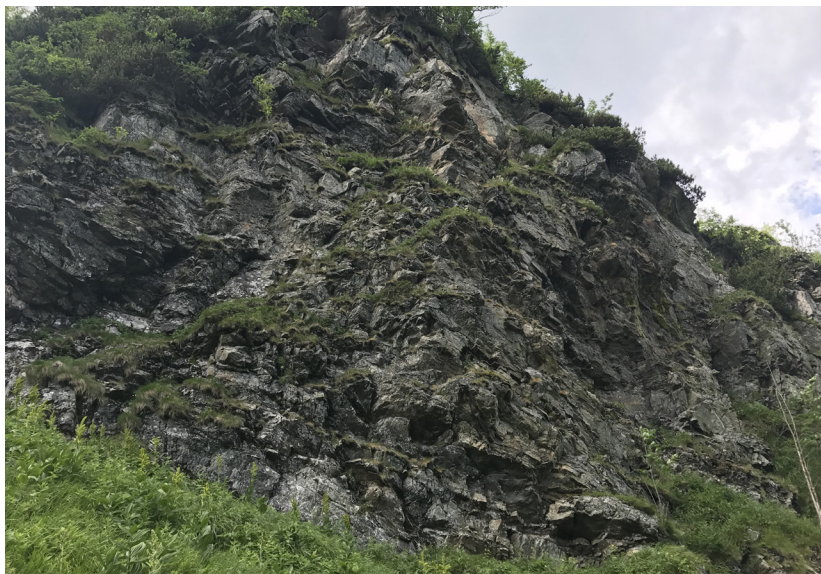
Ryc. 2. Mylonitowa ściana skalna, na której zlokalizowane jest nowe stanowisko rzadkich gatunków roślin w Dolince w Tatrach Zachodnich (22.06.2018 r.;)

Fig. 2. The mylonite cliff where the new locality of rare alpine plants was found in the Dolinka valley in the Tatra Mts, Poland (22 June 2018;)