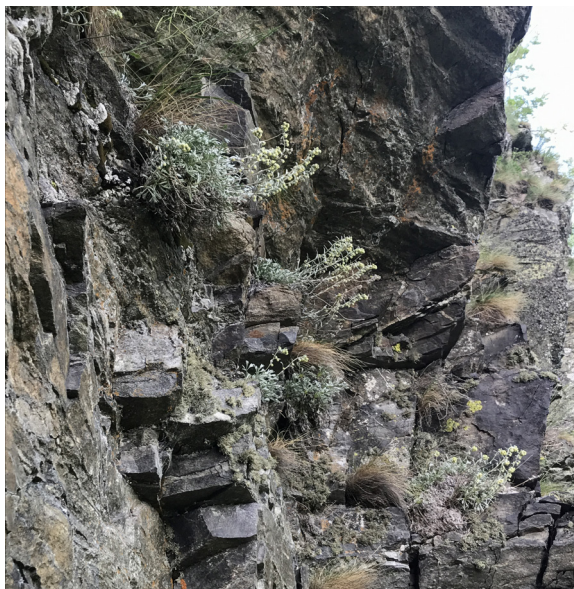
Ryc. 6. Wysokie i gęste kępy Artemisia eriantha na mylonitowych półkach skalnych na stanowisku w Dolince (ok. 1565 m n.p.m.) w Tatrach Zachodnich (22.06.2018 r.;)