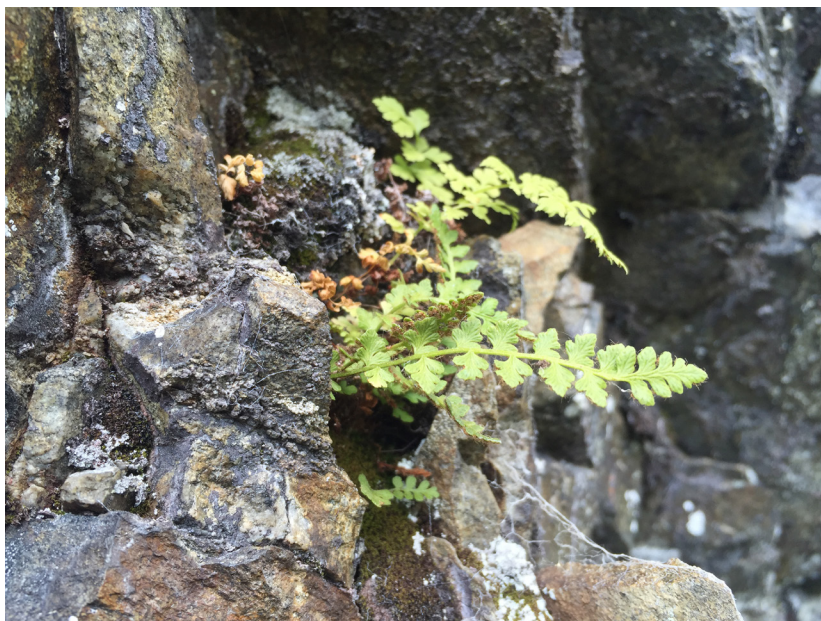
Ryc. 3. Woodsia alpina na stanowisku w Dolince (ok. 1550 m n.p.m.) w Tatrach Zachodnich. Wyraźnie widoczne charakterystyczne tępe, okrągławodeltoidalne odcinki pierwszego rzędu liści (17.08.2017 r.;)

Fig. 2. The mylonite cliff where the new locality of rare alpine plants was found in the Dolinka valley in the Tatra Mts, Poland (22 June 2018;)