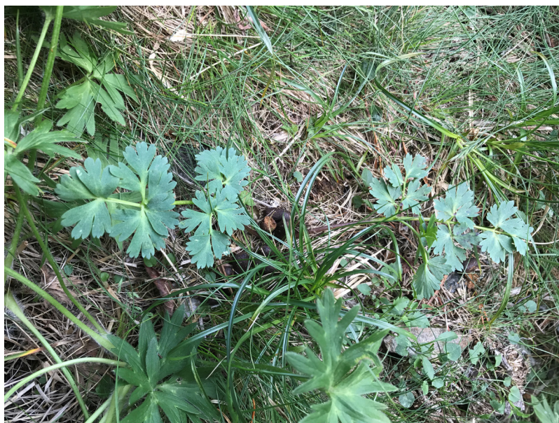
Ryc. 7. Pęd płożny Callianthemum coriandrifolium na stanowisku w Dolince (ok. 1550 m n.p.m.) w Tatrach Zachodnich (22.06.2018 r.;)